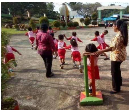
Gambar 1. Proses Bermain Enggo

Proses inti bermain enggo menurut (Genggong, 2018), diperankan lebih dari dua pemain. Satu anak menjadi penjaga enggo. Penjaga menutup mata sambil menghitung. Sementara itu, pemain lain berlari mencari tempat untuk bersembunyi. Penjaga harus bermain sambil bernyanyi. Ada lirik khusus yang harus dinyanyikan oleh penjaga. Lirik tersebut dijelaskan sebagai berikut. "Satu cari tempat, dua bersembunyi, tiga berhitung. Satu, dua, tiga, empat, lima, ...(menghitung sampai batas yang ditentukan)." Setelah selesai menghitung, penjaga mencari pemain lain. Jika penjaga menemukan salah satu, maka anak-anak berteriak "Enggo!" Lalu, pemain tersebut keluar dari tempatnya bersembunyi. Namun, ia belum kalah. Anak-anak masih bisa berlari ke enggo dan menyentuh tiang yang telah disepakati sambil berteriak "Enggo!" sebelum si penjaga sampai di sana. Siapa yang tidak bisa menyentuh enggo atau tiang lebih dulu, ia kalah dan menjadi penjaga. Proses bermain enggo selama penelitian tindakan ini dilakukan didokumentasikan pada Gambar 1. Proses Bermain Enggo berikut.